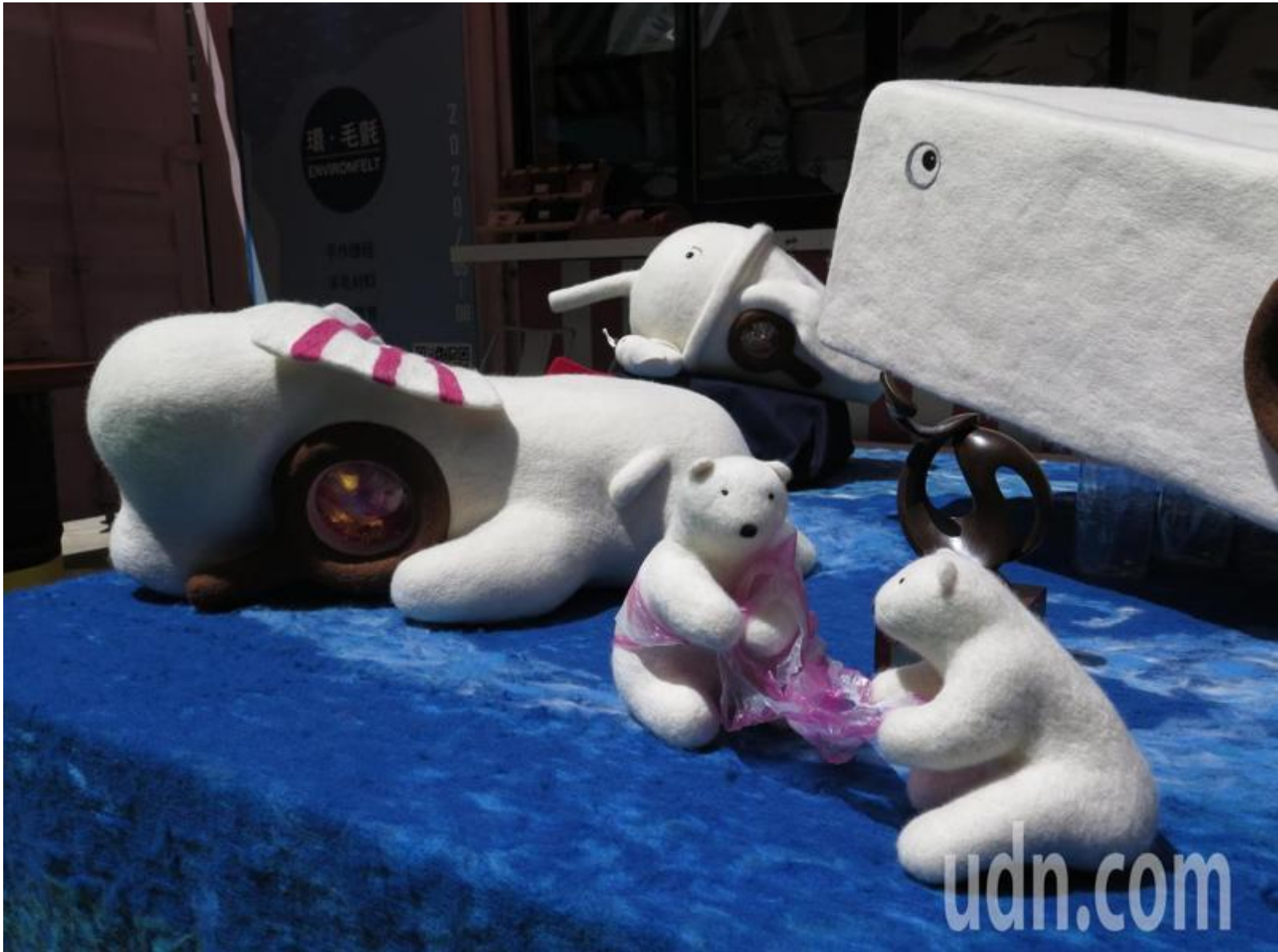
劉承祐的大型羊毛氈作品「海塑·天堂」，傳遞海塑對海洋生物的巨大傷害。