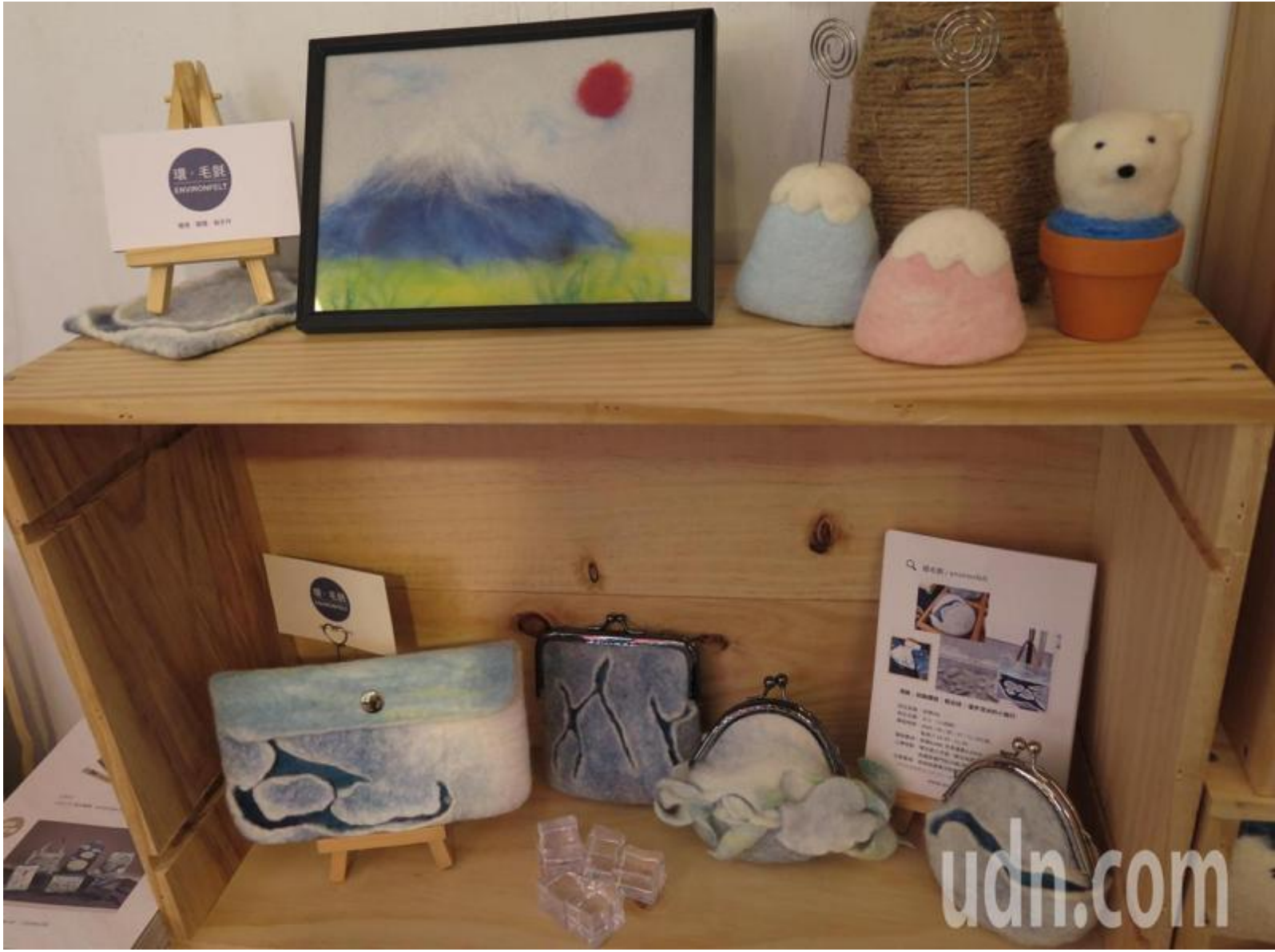
劉承祐的羊毛氈手作細膩，更融入對環境的關懷。