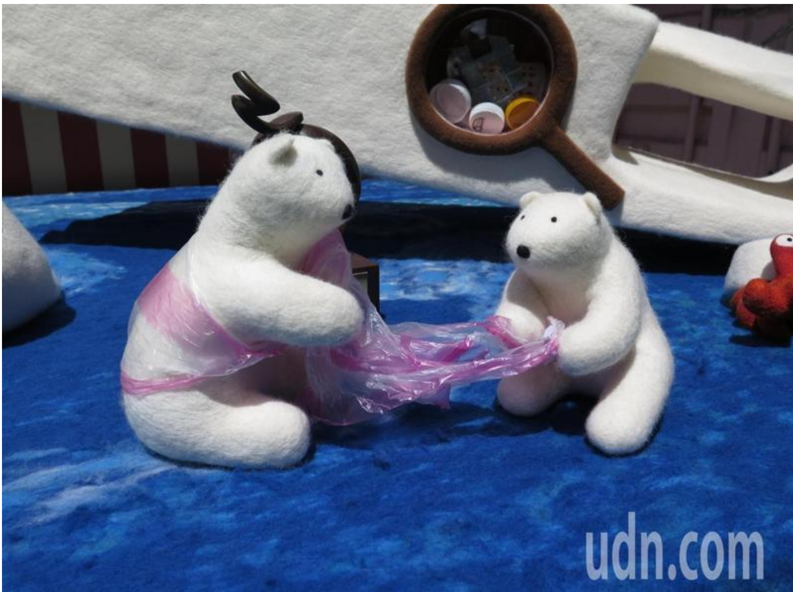
劉承祐的大型羊毛氈作品「海塑·天堂」，傳遞海塑對海洋生物的巨大傷害。