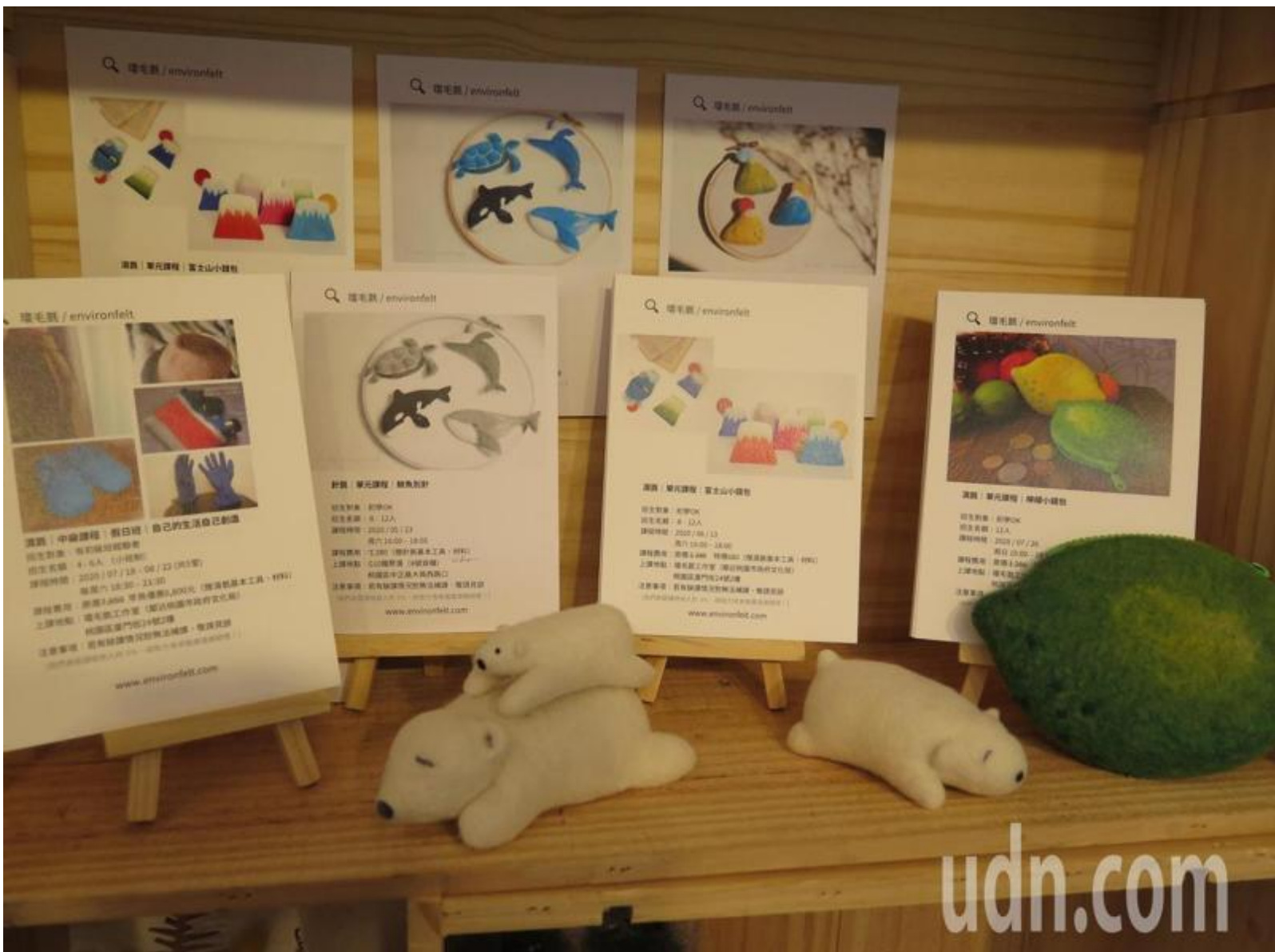
劉承祐的羊毛氈手作細膩，更融入對環境的關懷。