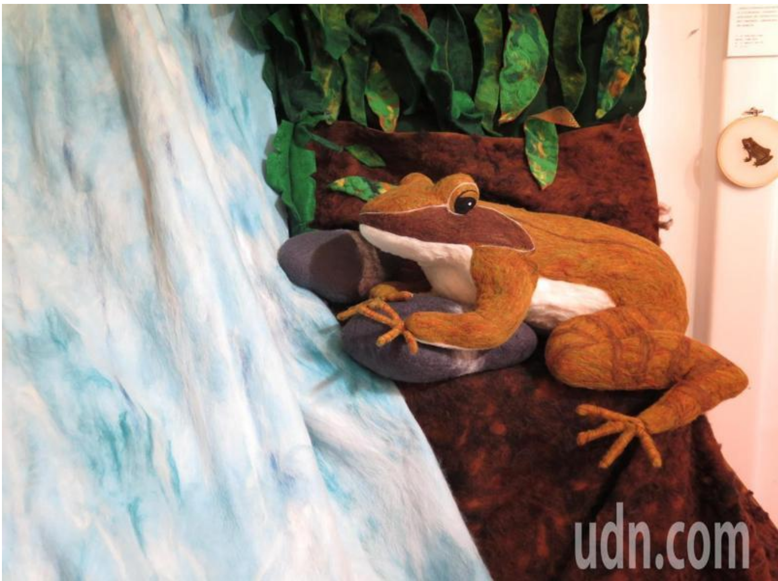
劉承祐的羊毛氈手作細膩，更融入對環境的關懷。