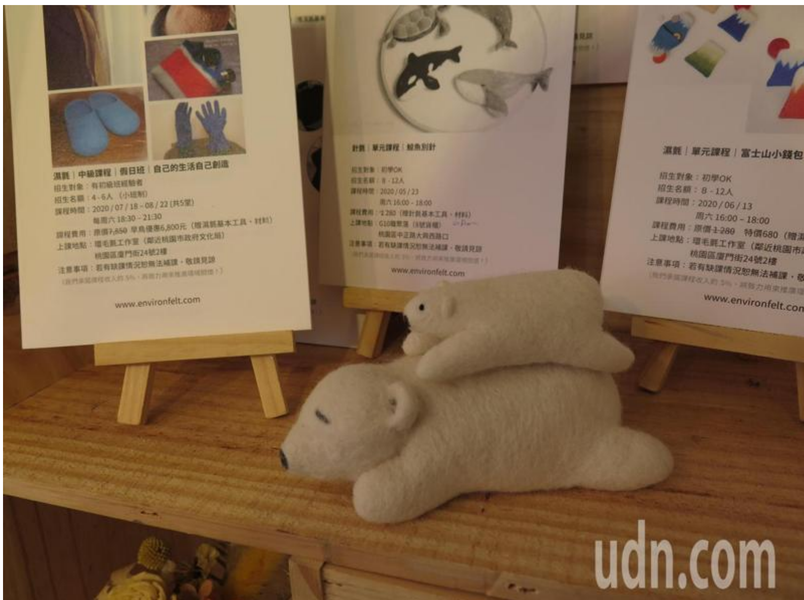
劉承祐的羊毛氈手作細膩，更融入對環境的關懷。